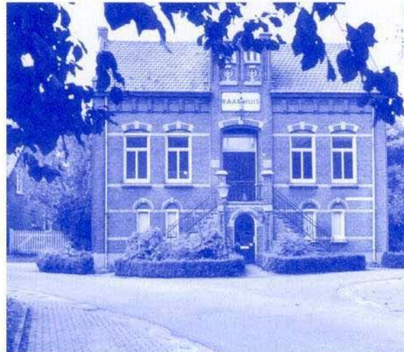
Voormalig Raadhuis te Lithoijen