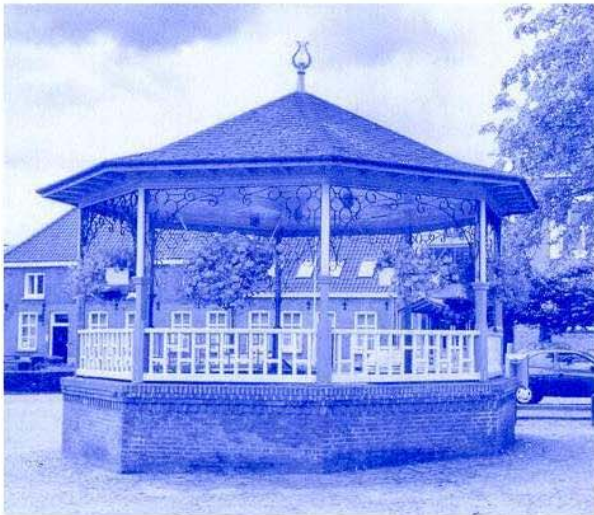
Marktplaatsje te Lith