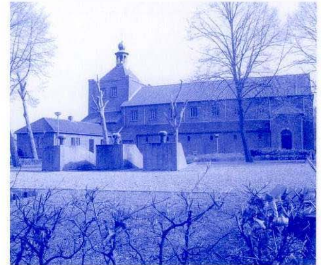
Kerkplein te Maren-Kessel